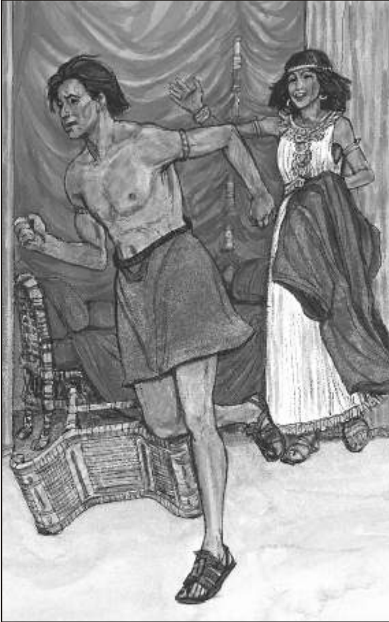
یوسف، آزمائش اور گناہ سے دُور بھاگ گیا