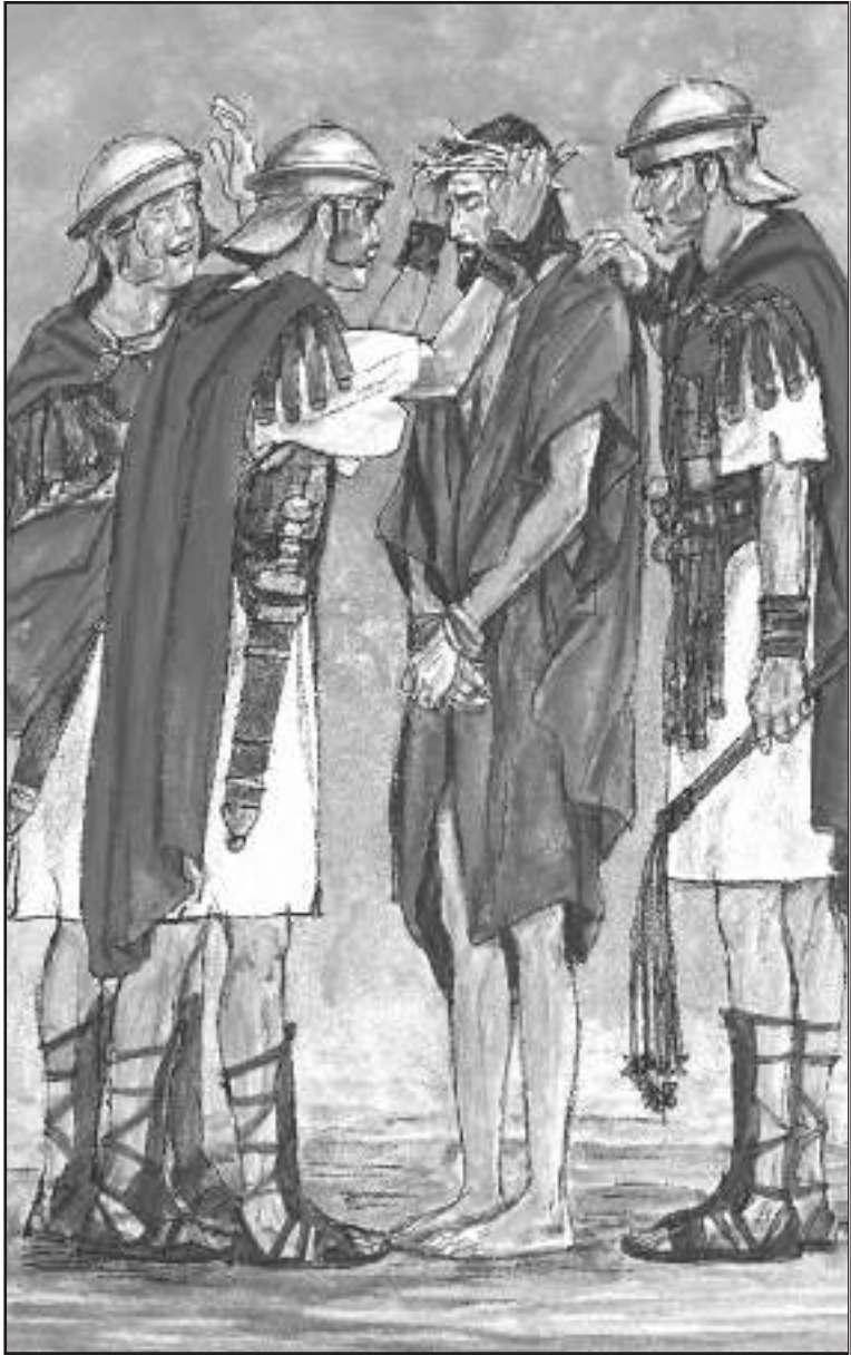
سپاہیوں نے یسوع کو مارا پینا اور ٹٹھوں میں اڑایا