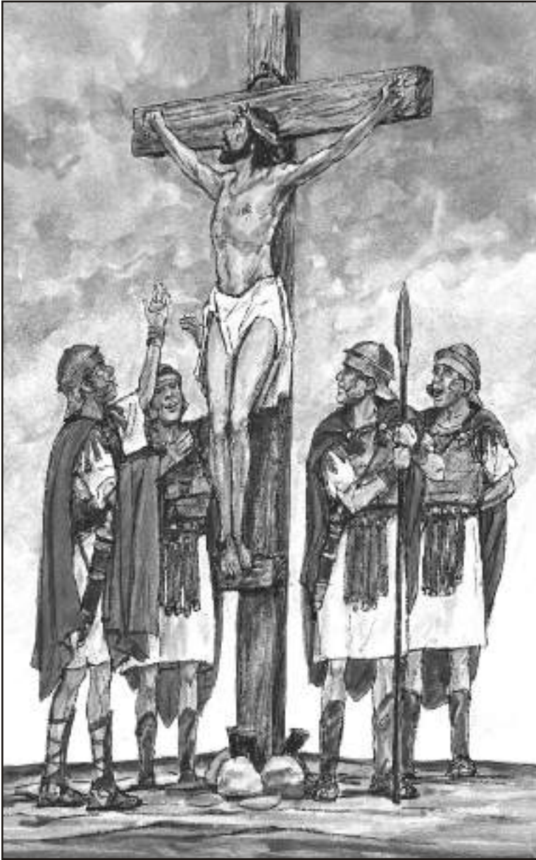
صليب پر بھی يسوع کا مذاق اڑایا گیا